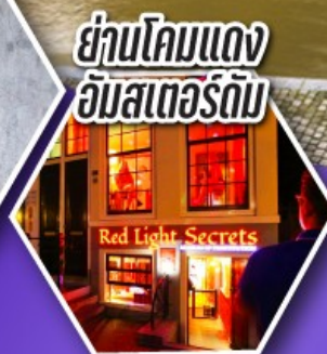
ย่านโคมแดง อัมสเตอร์ดัม

ตะลุยอัมสเตอร์ดัม ทั้งจตุรัสดามสแควร์ และย่านโคมแดง (Red Light) ราคาเริ่มต้น