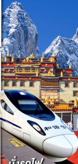
นั่งรถไฟ ความเร็วสูง