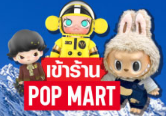
เข้าร้าน POP MART