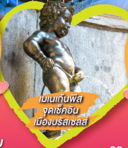
เมเนกันพีส จุดเช็คอิน เมืองบรัสเซลส์