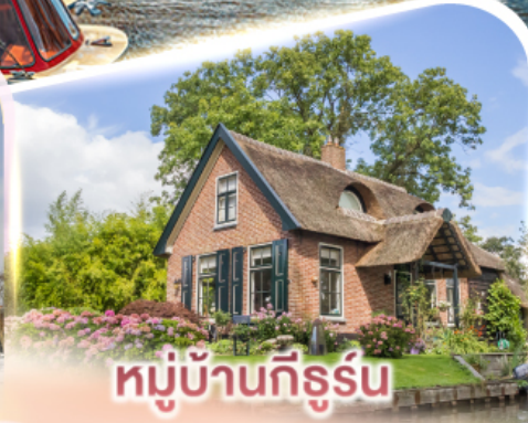
หมู่บ้านทึร์รูน