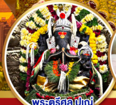
พระตรีศูล ปูณ (Trishul Pune)