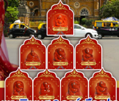
พระพิฆเนศ 8 องค์ เมืองปูณ