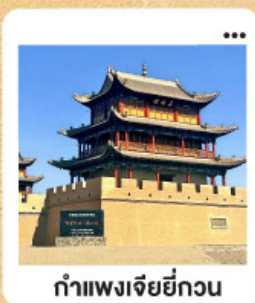
ถ้ำเพงเจียยี่กวน