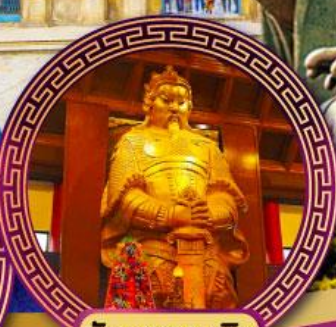
วัดเขangkหมิว