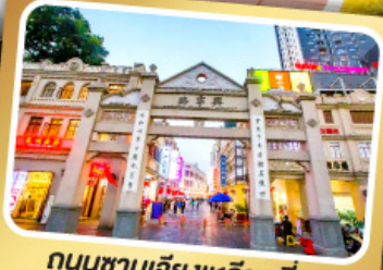
ถนนชานเจียงเหลียงเซียง