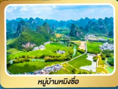
หมู่บ้านหมิงซือ