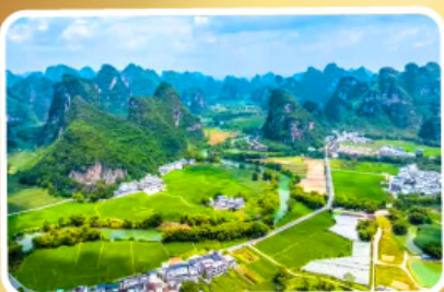
หมู่บ้านหนิงชื้อ