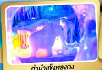
ตำนานแห่งหลงกง