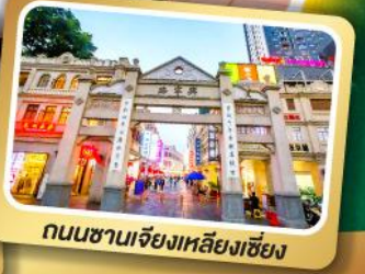
ถนนชานเจียงเหลียงเซียง