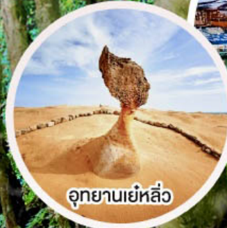
อุทยานเย่หลิว