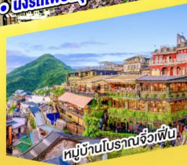
หมู่บ้านโบราณจิวเฟิ่น