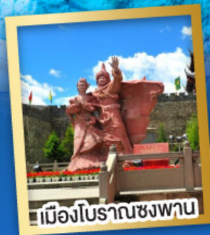
เมืองโบราณชงพาน