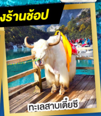
ทะเลสาบเต๋ยซี