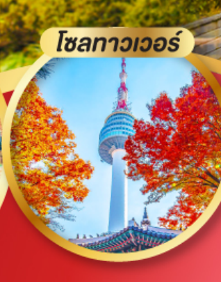
โซลทาวเวอร์