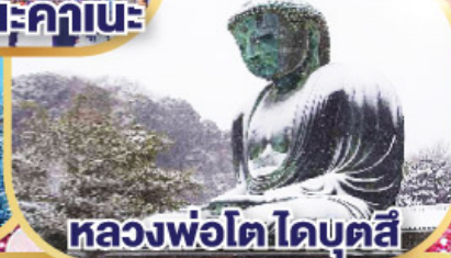
หลวงพ่อโตโตบุตสึ