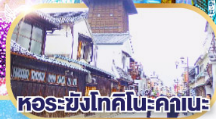
หอรังโทคิโนะคานะ