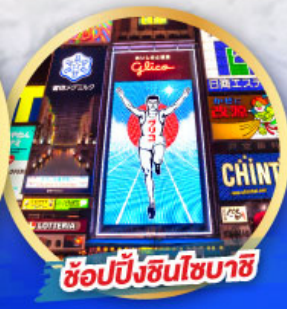
ช้อปปิ้งชินโซบาชิ