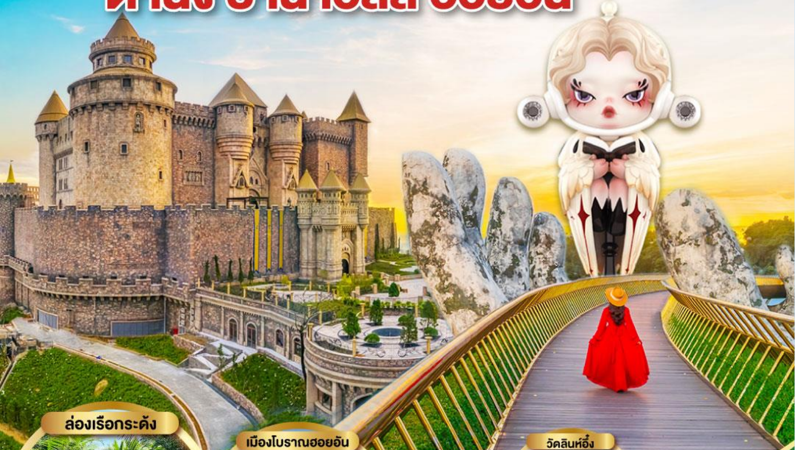
ล่องเรือกระด้ง