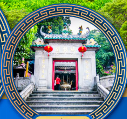
วัดอามา มาเก๊า