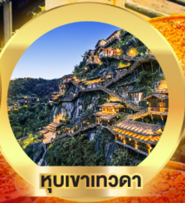
หุบเขาเทวดา