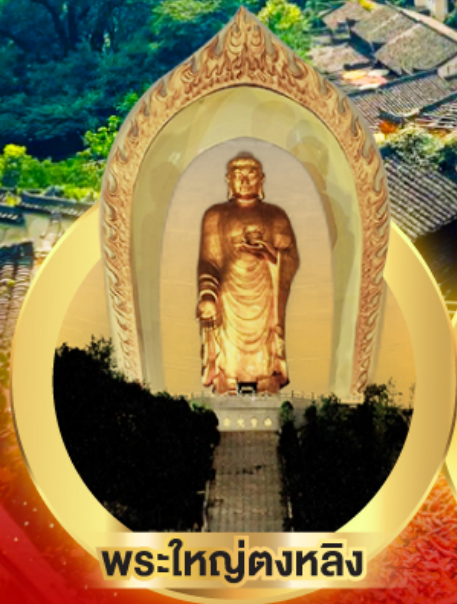
พระใหญ่ตงหลิง