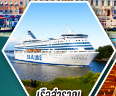
เรือสำราญ TALLINK SILJA LINE