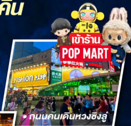
• ถนนคนเดินทองซิงหลู