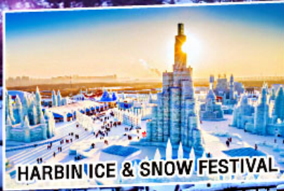
HARBIN ICE & SNOW FESTIVAL