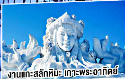
งานแกะสลักหิมะ เกาะพระอาทิตย์