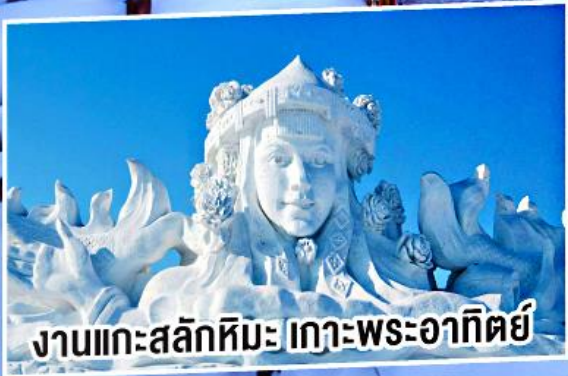
งานแกะสลักหิมะ เกาะพระอาทิตย์