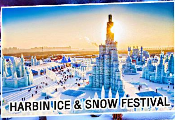
HARBIN ICE & SNOW FESTIVAL