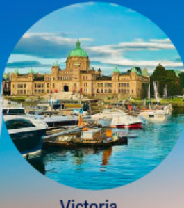
Victoria, British Columbia (Canada)