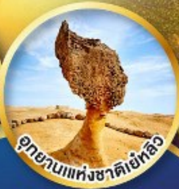
อุทยานแห่งชาติเย้หลิว