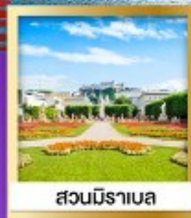
สวนมิราเบล