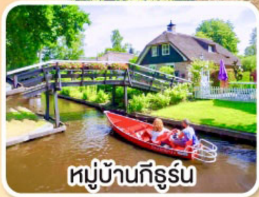
หมู่บ้านกังธูร์น