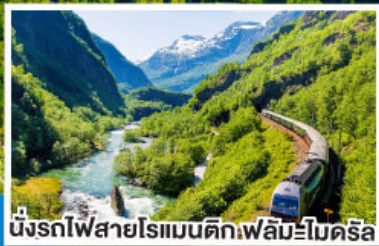
นั่งรถไฟสายโรแมนติกฟลัมโบโรคริส