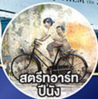
สตรีทอาร์ต ปีนัง