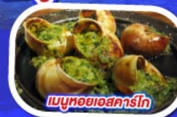
เมนูหอยแอสคาร์โท