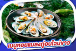
เมนูหอยแมลงภู่อบไวน์ขาว