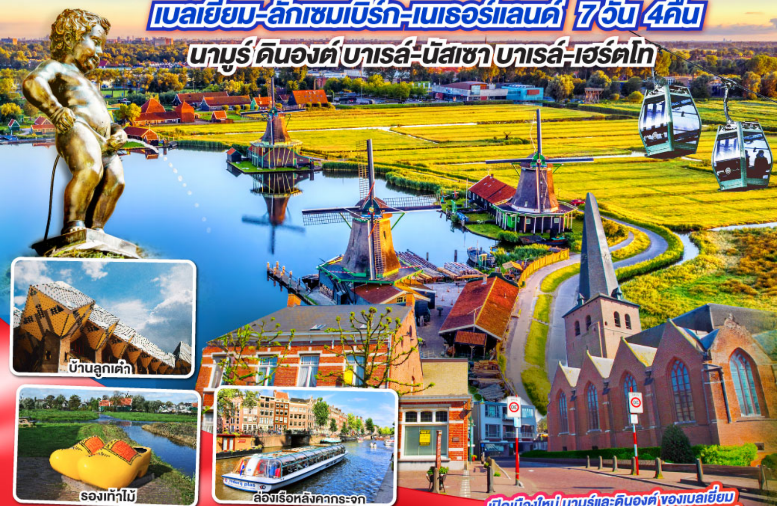
บ้านลูกเต่า

นาบูร์-ดินองต์-บารส์-นัสซา-บารส์-เฮร์ตโท