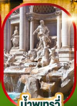
น้ำพุเทรวี่