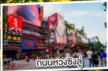
ถนนหวงซิงลี่