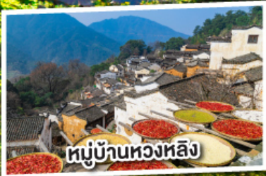
หมู่บ้านทวดา