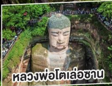
หลวงพ่อโตเล่อซาน