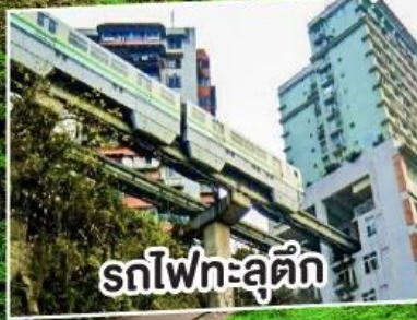
รถไฟเหาะลัดฟ้า