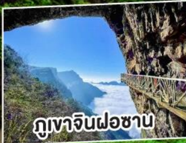
ภูเขาจินฝอซาน