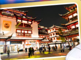
ตลาดร้อยปีเฉิงหวงเหมียว