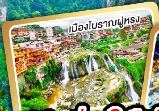
เมืองโบราณฝูหลง