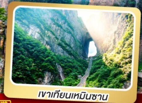
เวาเทียนเหมินซาน

ทริปเดียวเที่ยว 2 เมืองโบราณ ฝูหลงและเฟิ่งหวง