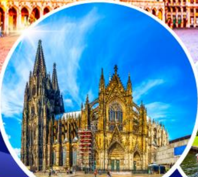
มหาวิหารแห่งโคโลญ หมู่บ้านกีธูร์น