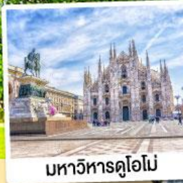
มหาวิหารดูโอโม

09-15 พ.ย. 67 28 ม.ค.-03 ก.พ. 68 12-18 มี.ค. / 11-17 เม.ย. 68 07-13 พ.ค. 68