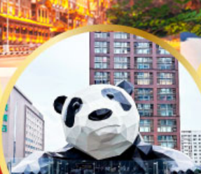
หมีแพนด้าป็นตึก