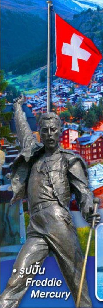
• รูปปั้น Freddie Mercury

พีชิต 5 เวาริกี, เวาฮาร์เตอร์คุม, เวาจุงเฟรา เวากลาเซียร์ 3000 และ เวากรอนเนอร์แกรต