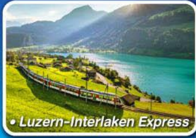
• Luzern-Interlaken Express