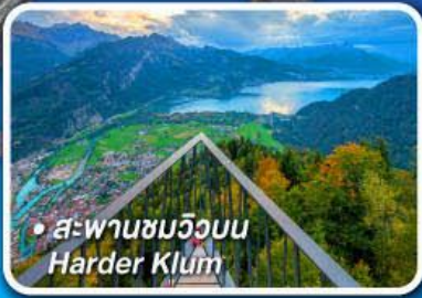
• สะพานชมวิวนบน Harder Klum