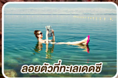
ลอยตัวที่ทะเลเดดซี