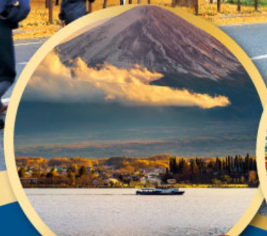
ทะเลสาบคาวากุจิโกะ