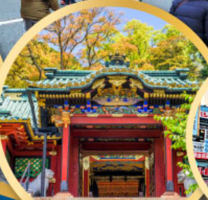
ศาลเจ้าโทโชคุ