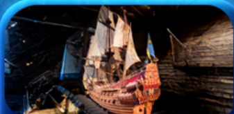
พิพิธภัณฑ์ทิวาชา

Scandinavian Lover Capital Sweden Norway Denmark