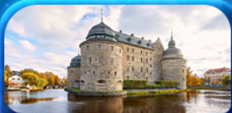
ปราสาทโฮเรโบร

รหัสโปรแกรม : SEK168 9วัน 6คืน เที่ยวบินโฮล์ม-ออกโคเปนเฮเกน