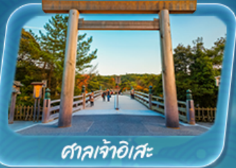
ศาลเจ้าอิสะ

12 - 17 พ.ค. 69 / 19 - 24 พ.ค. 69 26 - 31 พ.ค. 69 / 2 - 7 มิ.ย. 69 9 - 14 มิ.ย. 69