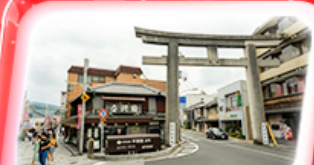
ถนงชาเขียว

Highlight ชมความงามหมู่บ้านมรดกโลก หมู่บ้านชิราคาวาโกะ เมืองเก่าทาคายามา ทะยานสู่ฟ้า กำแพงวิว Panorama ขึ้นกระเช้าลอยฟ้าโทโซโซ พลาดไม่ได้ ปราสาทโอซาก้า วัดเมียวโดอิน ถนนชาเขียว โอโมเตะเซนโด ช้อปปิ้งย่านชินโซบาชิ และ Outlet