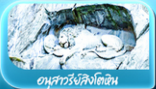
อนุสาวรีย์สิงโตหิน