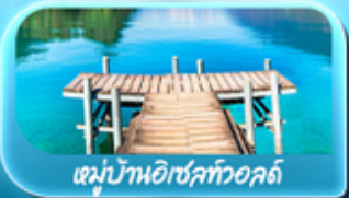
หมู่บ้านอิเชิลทออลด์