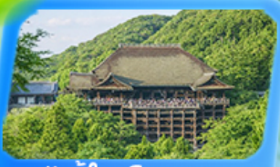
วัดน้ำใสคิโยมิสุเดระ