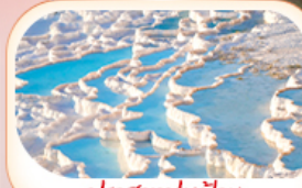
ปราสาทปูยฝ้าย