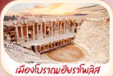
เมืองโบราณฮังราโพลิส