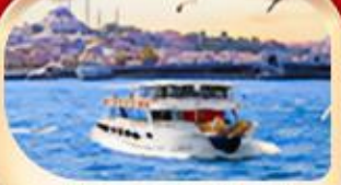
ช่องแคบบอสฟอรัส