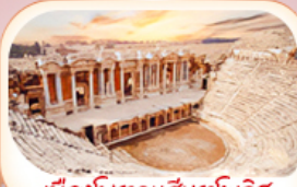
เมืองโบราณฮิยราโพลิส