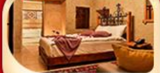
คัปปาโดเกีย