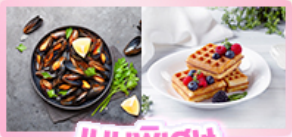
เมนูพิเศษ หอยมัสเซล+วาฟเฟิล