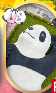
หมีแพนด้าเซลฟ์