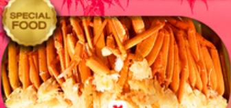
อาหารมือพิเศษ บุฟเฟ่ต์จางู