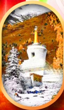
อุทยานสี่ตุ๋น