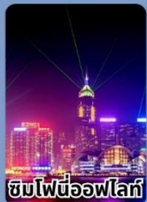
ชมไฟนีออนไฟรี่