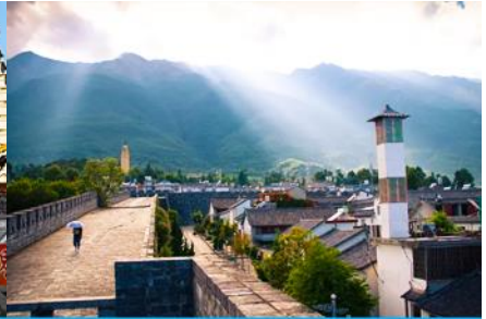
หมู่บ้านซีโจว(หมู่บ้านชาวปื)