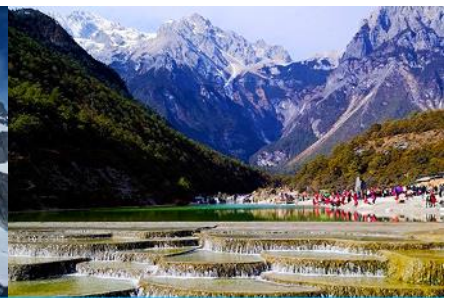
หุบเขาพระจันทร์สีน้ำเงิน "ไปสู่อุทยาน"

วันที่สี่ ภูเขาหิมะมังกรหยก (รวมนั่งกระเช้าใหญ่ขึ้นลง)– หุบเขาพระจันทร์สีน้ำเงิน-น้ำตกไปสู่อุทยานออฟชั่น ไกด์ขายรถกอล์ฟ ท่านละ 80 หยวน โชว์ IMPRESSION LIJIANG- อุทยานน้ำหยก -ต้าหลี่